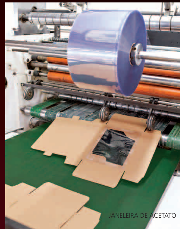
JANELEIRA DE ACETATO