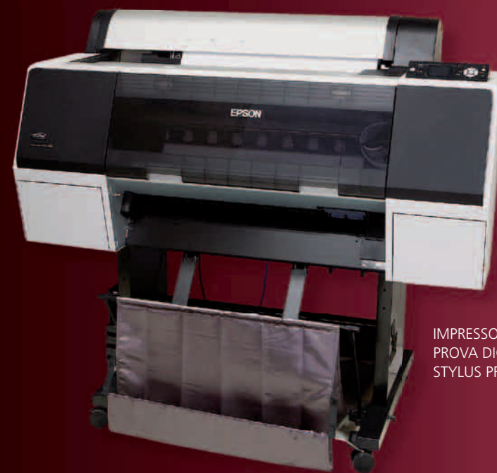
IMPRESSORA DE PROVA DIGITAL EPSON STYLUS PRO 7890

Estrutura equipada nas plataformas Mac e PC, com todos os softwares gráficos constantemente atualizados e sistema de gerenciamento de cores, que permite linearização entre prova de cor, monitor e impressão. Nossa qualidade é assegurada e certificada pela ISO 9001 desde 2002. O cliente recebe toda a assistência e atendimento personalizado, criação e desenvolvimento e o compromisso com a agilidade na fabricação e na entrega. E tudo isso com versatilidade para atender tanto pequenas quanto grandes tiragens. Ainda contamos com frota própria e transportadoras parceiras para atender a todo o Brasil. São alguns dos diferenciais que tornam cada embalagem produzida pela Embagraf um projeto exclusivo.