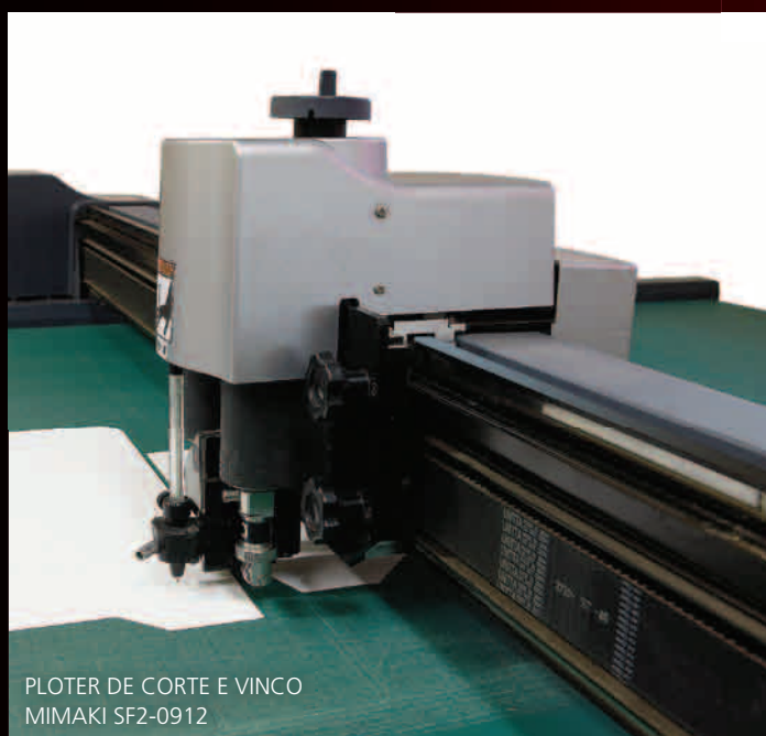
PLOTER DE CORTE E VINCO MIMAKI SF2-0912

A EMBAGRAF POSSUI UM EFICIENTE PROGRAMA DE REUTILIZAÇÃO DE APARAS